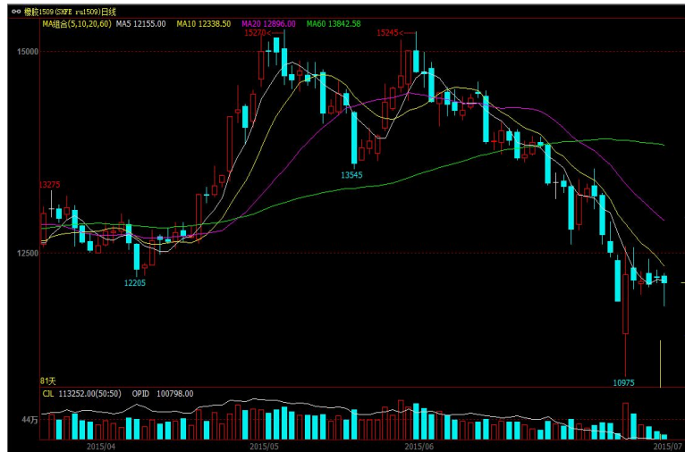
图 2、国内外天然橡胶期货市场走势对比图