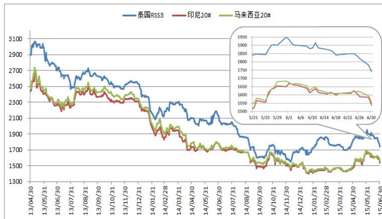
图 4、国际市场天然橡胶价格走势

期货市场大幅回落，6 月份外盘价格也处于跌势，甚至跌幅较大。中国下游市场需求疲软，整体交投情况无明显改善，加上期货价格下行带来的压抑气氛和悲观预期，外盘价格小幅走跌。